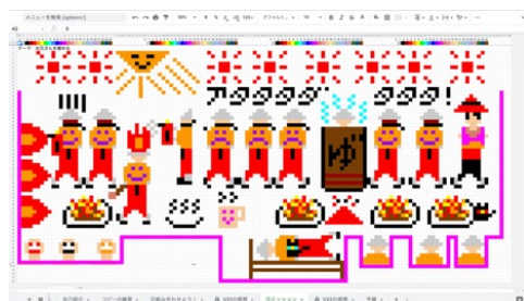
ICTを利用したデジタルアート作成例（共同作業例）